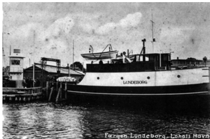
Lundebergfærgen i Lohals havn

Bostrup sejlede herefter i nogle år på ruten Svendborg-Drejø med færgen, der i 1974 blev solgt til ophugning. Skroget blev sænket ved Rantzausminde. Hvor det danner brohoved ved derværende bådebro.