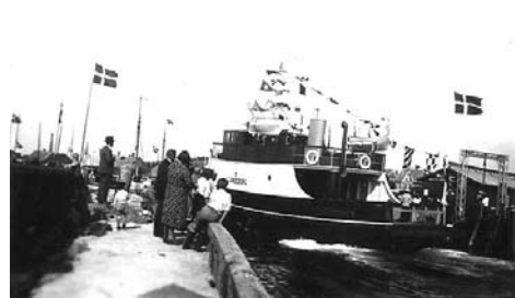
1 maj 1932 En tur til Lohals

Der var mange mødt op på havnen for at byde den nye færge velkommen, og om aftenen holdt det nystiftede A/S Lohals-Lundeborg Færgeselskab middag på Houborghus. Næste dag gik færgen i fart på ruten Lohals-Lundeborg.